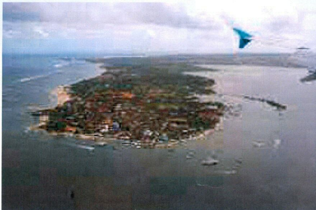
Una foto aerea di Tuhemberua, che si trova a nord di Nias