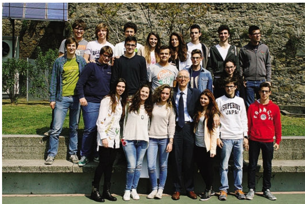
Ecco la squadra «I palafreni» del Sant'Alessandro, in corsa alle Olimpiadi del Talento e della Cultura

Per la cronaca, la 4ª B del liceo scientifico del Sant'Alessandro nella semifinale al 16º posto con 360 punti. La migliore ne ha conseguito 450, come dire che la partita è tutta da giocare, e noi di Cartolandia facciamo il tifo per loro: forza «Palafreni»!!! ■